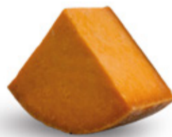
Double Gloucester United Kingdom