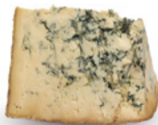
Stilton United Kingdom

Nos crackers sont très sociables et s'entendent à merveille avec tous les fromages.