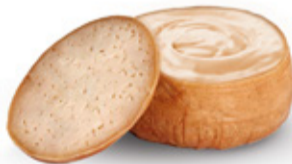
Torta del Casar Spain