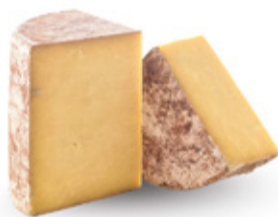
Aged Cheddar USA

Nos crackers sont très sociables et s'entendent à merveille avec tous les fromages.